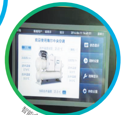
智能介面管理系統

配備無油磁浮軸承離心式壓縮機的節能冷水機的設計壽命長達25年，系統採用磁浮軸承壓縮機技術、變頻控制技術、無油潤滑等先進技術，因此產品能效比有了很大的提高，綜合能效比(IPLV)最高可達到11.98，較普通的小型冷水機組節電約50%。磁浮軸承技術可實現機組的無油運行，避免常規壓縮機軸承因高摩擦、振動的損失，亦不需要回油壓差，可以做高溫出水(18℃)機組。變頻控制技術使壓縮機最高轉速高達48,000轉/分鐘，可變速驅動技術可按實際製冷量需要把壓縮機效率優化。加上機組採用環保冷媒HFC-134a，臭氧層損耗值(ODP)為零，具有環保效益。